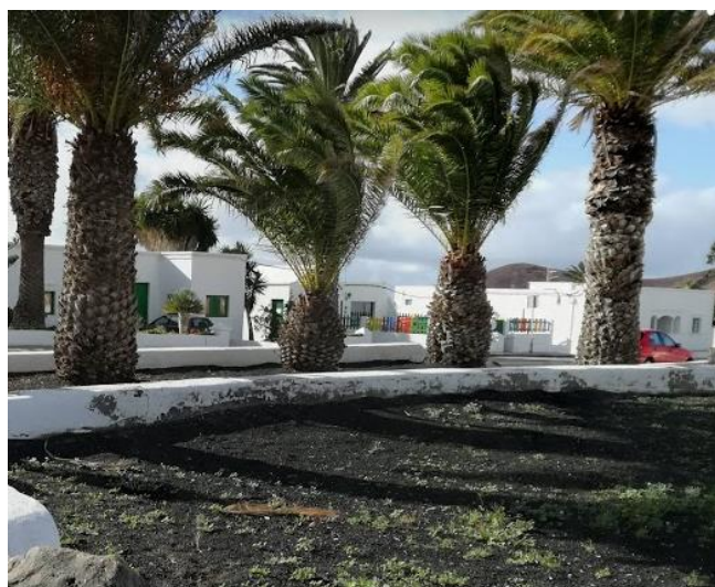
Imagen 1 y 2. Parque de César Manrique (Tinajo)